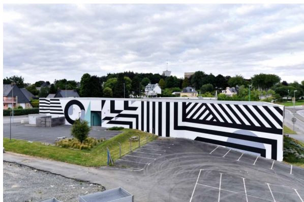
Everybody Razzle Dazzle, peinture murale. Collectif XYZ soutenu par la fourmi.e et Biocoop. Festival InCité - Carhaix. Juin 2018