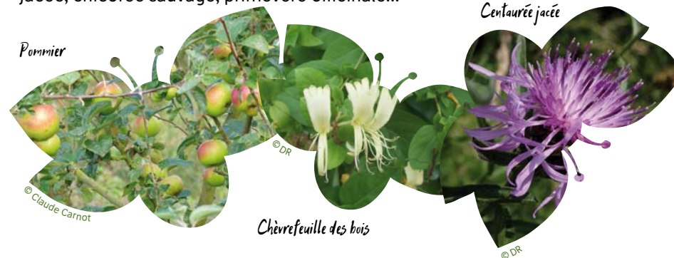
Chèvrefeuille des bois