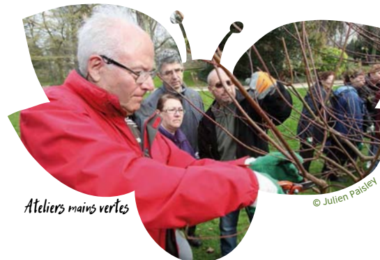
Ateliers mains vertes

Pour éviter les contaminations, ne pas oublier de laver et désinfecter les outils ayant servi à tailler une plante malade.