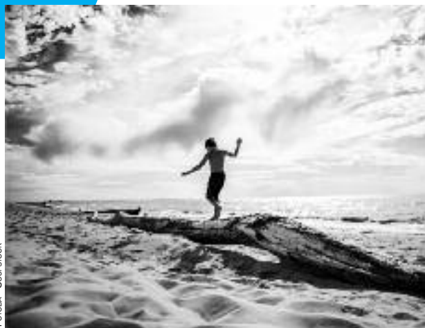
FOROUSA - SHUTTERSTOCK

MERCREDI 19 SE TIENDRA LE FORUM vacances de la ville pour les séjours d'été. Au programme, des séjours à thèmes pour les 6-11 ans, itinérants pour les 12-14 ans, à la ferme pour les 4-5 ans, linguistique pour les collégiens et famille à La Croix-Valmer ! Profitez-en, préinscription possible le jour même sur place.