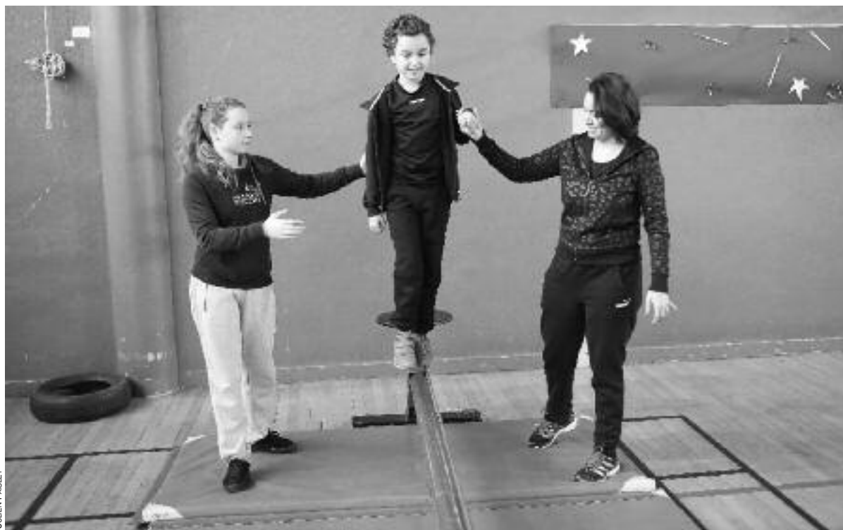
Une émulation des familles sportives du club omnisport de Vitry.

L'ESV organisait, le 17, la première édition du Noël des familles. Un événement convivial pour découvrir le sport, renforcer la cohésion entre sections et annoncer la course la Vivicitta en avril.