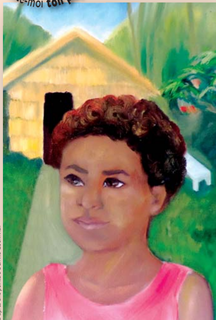
D'après une peinture d'Emilie Couffinal.