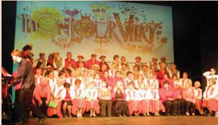
Winzerchor et Tourdion à Meissen

On ne peut manquer en arrivant à Meissen, les coteaux recouverts de vignes appartenant à de petits propriétaires. C'est en se rencontrant dans leurs vignes et en chantant en l'honneur du bon vin de Meissen que leur est née, en 1987, l'idée de monter une chorale.