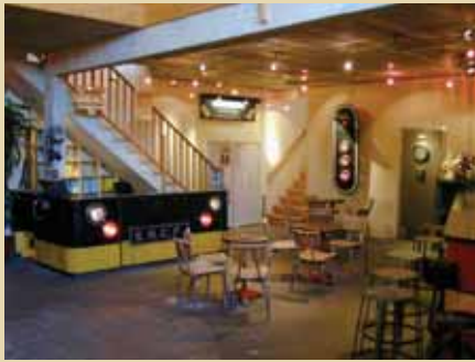
Gare au Théâtre.

En 1996, la Cie de la Gare, installée sur le site depuis 1986, décide de transformer la grande halle de déchargement de la gare de fret de Vitry en lieu pluridisciplinaire et atypique dévolu aux compagnies indépendantes et aux écritures contemporaines. Gare au Théâtre ouvre au public en 1998.