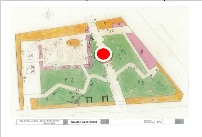
Photo de l'emplacement