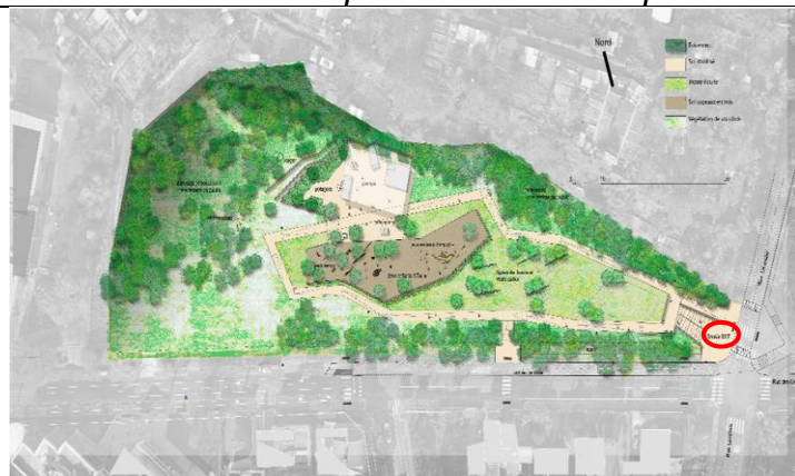
Photo de l'emplacement