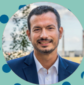
Pierre Bell-Lloch, Maire de Vitry-sur-Seine

A stylized, handwritten signature in white ink that reads "Bell-Lloch". The signature is fluid and cursive, with a long horizontal stroke at the end.