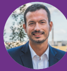
Pierre Bell-Lloch Maire de Vitry-sur-Seine