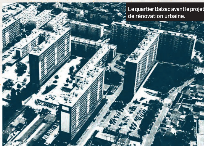
Le quartier Balzac avant le projet de rénovation urbaine.

Cette avancée permet de rééquilibrer l'offre de logements sociaux en favorisant la construction dans des quartiers sous-dotés comme les Malassis ou le Port-à-l'Anglais.