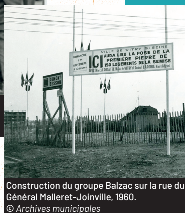
Construction du groupe Balzac sur la rue du Général Malleret-Joinville, 1960.