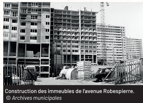
Construction des immeubles de l'avenue Robespierre.