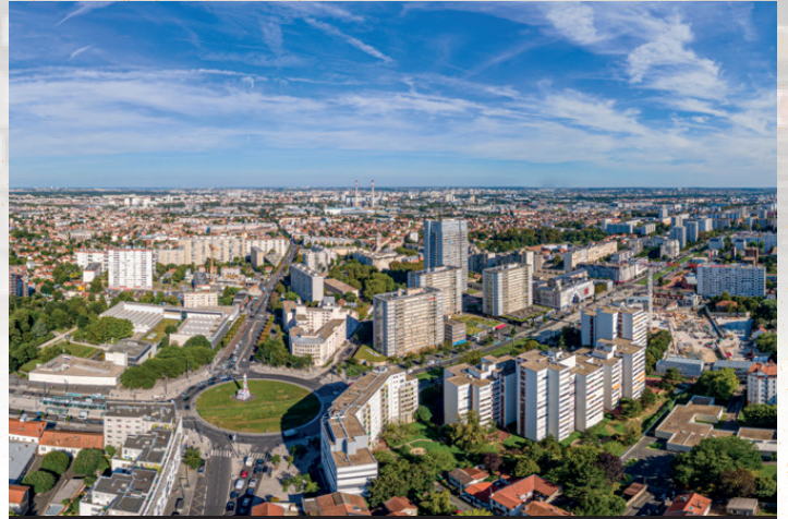
Vue aérienne, Vitry-sur-Seine. 2024.

En 2025, la ville a lancé, avec les habitants, la campagne « Des écoles plutôt que des missiles » pour soutenir la construction d'un deuxième établissement scolaire dans la ZAC Seine-Gare.