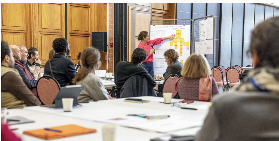
Premier séminaire de révision de la charte promoteurs : architectes et ville engagés pour un habitat de qualité. Janvier 2025.

Et demain ? Des séminaires sont en cours avec des architectes et promoteurs afin de dessiner les logements de demain et leur environnement.