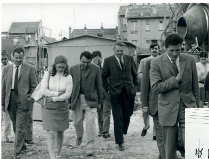
Visite de chantier pour la construction d'immeubles de logements par la SEMISE, boulevard de Stalingrad et rue Auber, en présence d'élus, 1960.

En 1973, le maire décide de privilégier l'accélération de construction d'équipements publics (piscine, théâtre Jean Vilar, patinoire) et d'espaces verts.