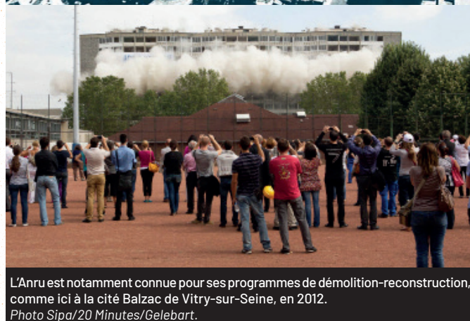
L'Anru est notamment connue pour ses programmes de démolition-reconstruction, comme ici à la cité Balzac de Vitry-sur-Seine, en 2012.