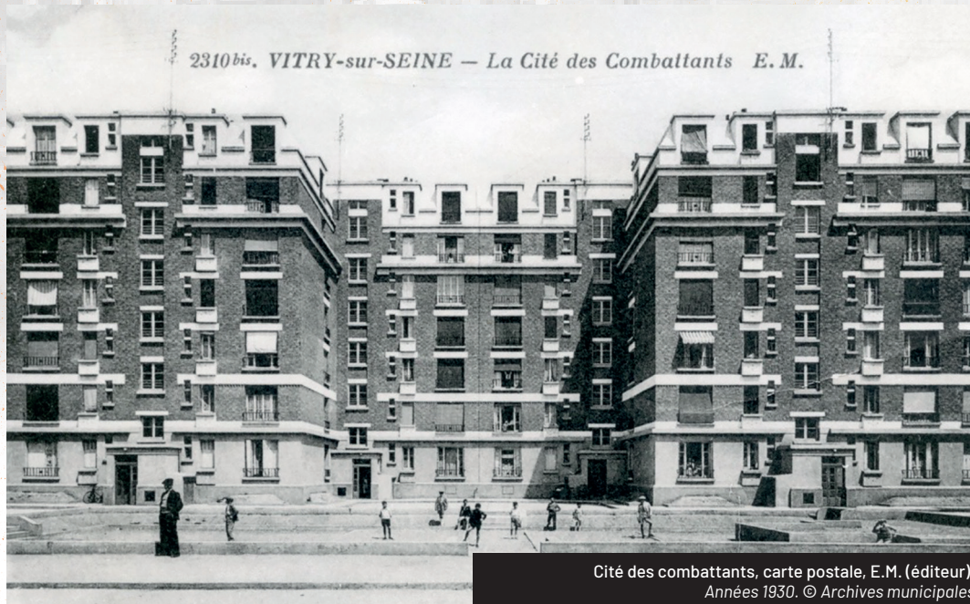
Cité des combattants, carte postale, E.M. (éditeur). Années 1930.

premières opérations d'habitat bon marché (HBM, ancêtre des HLM) est lancée : la cité Désiré-Granet, avec 92 logements, eau courante et sanitaires.