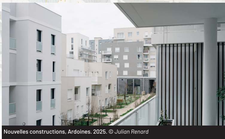
Nouvelles constructions, Ardoines. 2025.

En 2013, la ville signe une charte des promoteurs et logement social visant à garantir la qualité des logements neufs et des prix accessibles aux Vitriot-e-s. Cette charte est régulièrement étoffée afin d'assurer la durabilité du parc immobilier.