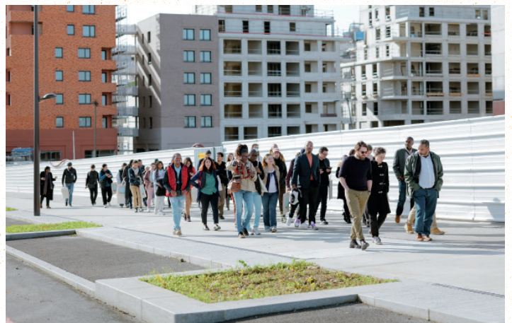
Visite du nouveau quartier des Ardoines avec les habitants et les élus lors de la journée d'accueil des nouveaux arrivants à Vitry. Photographie de Hugo Lebrun, 2024.

C'est le sens de la bataille menée sur l'OIN face à l'Etat en 2021 afin de permettre aux Vitriot·e·s d'accéder aux 8 000 logements prévus sur les Ardoines et Seine-Gare d'ici 2030. Un projet d'ampleur, adapté aux défis actuels, et dont les premières pierres ont vu le jour avec le secteur Descartes en 2023, accueillant 900 logements.