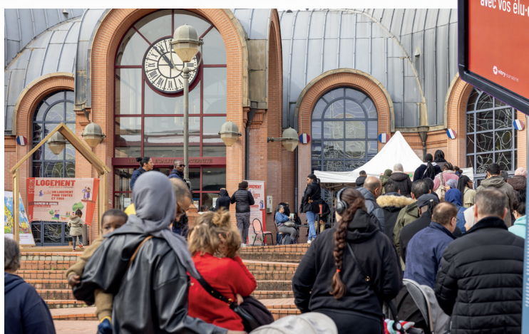
Forum logement, 2ème édition. 2024.

Les services de la ville et les élu.e-s ont ainsi multiplié en quelques années les permanences à destination des vitriote.s afin de les accompagner dans la constitution de leurs démarches, compris auprès des bailleurs ou de la préfecture.