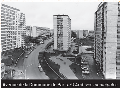
Avenue de la Commune de Paris.