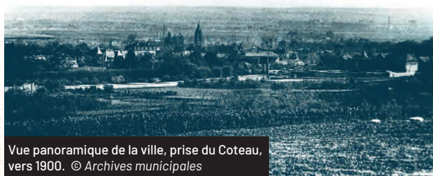
Vue panoramique de la ville, prise du Coteau, vers 1900.

Elle est réalisée par une structure alors toute jeune : l'Office public d'habitation à bon marché, OPHBM. À côté de cette cité, un autre projet social, encore plus grand – 454 logements – est conçu en 1932, par l'association Fiac (Foyer des Invalides et des Anciens Combattants) : la cité des Combattants. Au cours des années 30, d'autres cités collectives voient le jour : Albert-Thomas, Ambroize Croizat et Charles Floquet. Un millier de familles ouvrières s'installent dans ces premières habitations à caractère social.