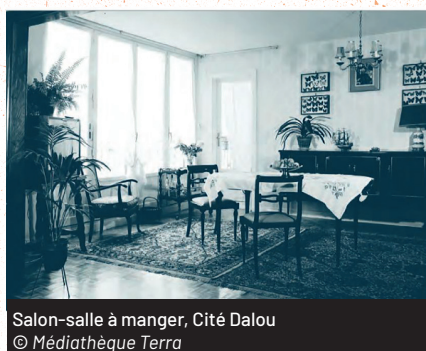
Salon-salle à manger, Cité Dalou