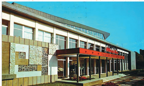
Carte postale du Palais des sports Maurice Thorez construit par Mario Capra