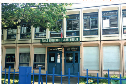
Façade de l'école Jean Moulin

À partir de 2006, la Semise mène, à Balzac, une rénovation urbaine soutenue par l'ANRU, en concertation avec les habitants et soutenue par l'ANRU. Aujourd'hui, l'organisme gère à Vitry plus de 3 600 logements, soit le 2 ème parc de la ville.