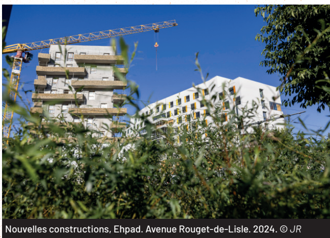
Nouvelles constructions, Ehpad. Avenue Rouget-de-Lisle. 2024.

Concernant les logements anciens, les services municipaux interviennent pour lutter contre l'habitat indigne et accompagnent les copropriétés afin de favoriser leur bonne gestion et leur entretien. Plus récemment, la ville a renforcé ses dispositifs de contrôle en instaurant un permis de louer, qui entrera en vigueur le 1er octobre 2025. Ce dispositif vise à lutter contre l'habitat indigne en imposant une vérification préalable des logements mis en location. Il permet ainsi de s'assurer que les biens loués respectent les normes de décence et de sécurité, garantissant ainsi de meilleures conditions de logement pour les locataires.