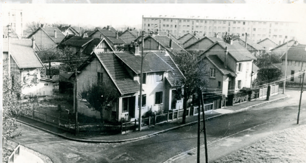
Vue du quartier du Moulin Vert. Photographe non identifié. Service archives-documentation, non datée