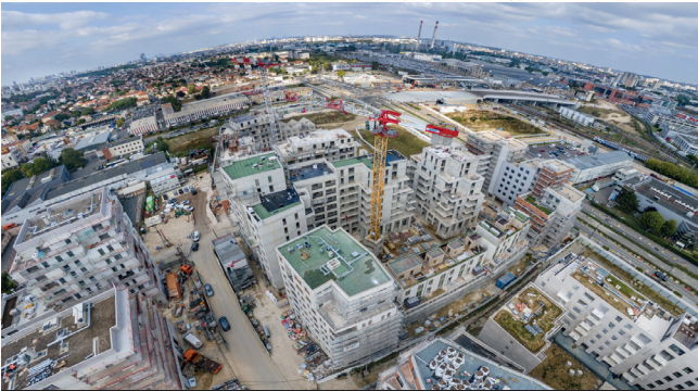
Vue aérienne, nouvelles constructions aux Ardoines. 2024.

Face à ces nouveaux défis, la municipalité, fidèle à son histoire, entre dans un nouveau bras de fer avec l'Etat, afin d'obtenir les moyens nécessaires aux réhabilitations, mais aussi à l'aménagement du territoire et au développement des services publics (écoles, gymnase, parc etc.).