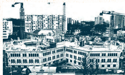
Chantier de construction de l'hôtel de ville en 1984. Michel Aumercier © Archives municipales