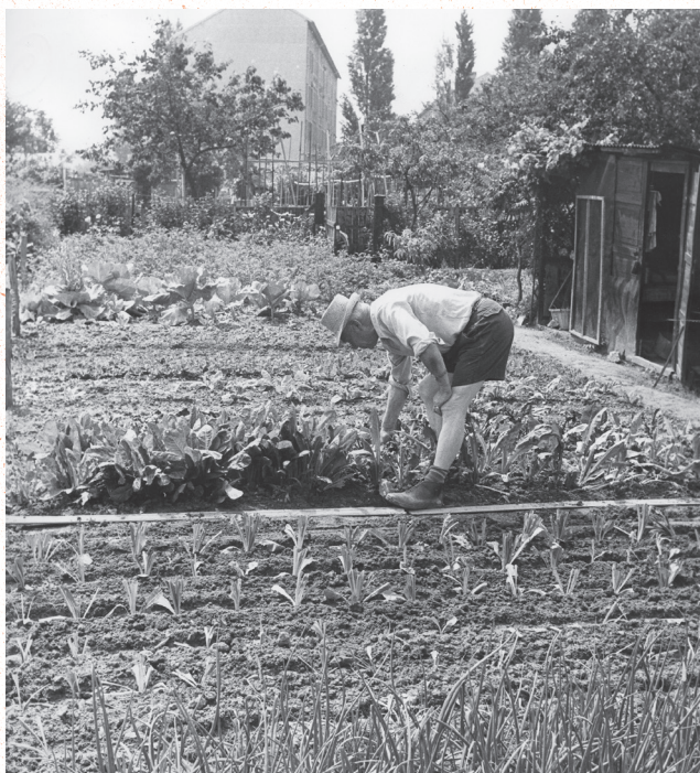
Vue sur les jardins familiaux « Mazagran », avenue Gabriel Péri, quartier de la Ferme. Photographie Chouraqui. Service archives-documentation. Années 1980.