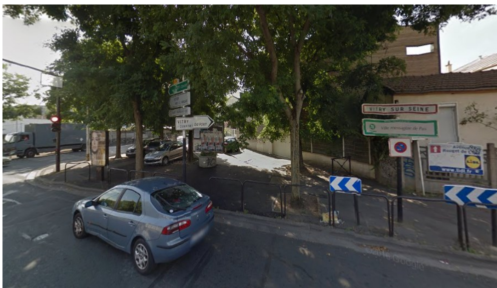
La place avant l'aménagement

Les habitants sont satisfaits de l'aménagement même si les vélos continuent à éviter le feu en empruntant le trottoir.