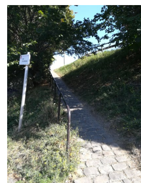
Rue Odessa: difficulté du cheminement piéton, trottoir trop étroit, manque d'éclairage...

Madame Guénine suggère à la fin du conseil, de faire un diagnostic sur site, de façon plus précise, sur une partie des points soulevés en présence des services de la ville et des habitants le samedi 16 novembre à partir de 10h00.