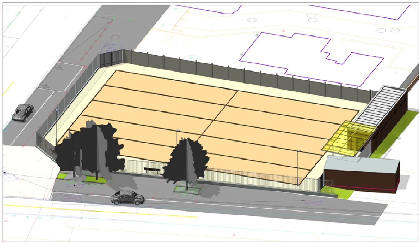
Une vue aérienne du projet de boulo-drome, intégrée au quartier du Plateau.