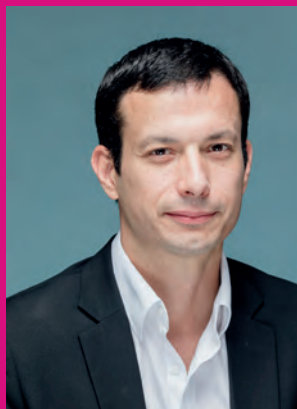
Pierre Bell-Lloch Maire de Vitry-sur-Seine