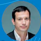
Pierre Bell-Lloch, Maire de Vitry-sur-Seine

A stylized, handwritten signature in white ink that reads "Bell-Lloch". The signature is fluid and cursive, with a long horizontal stroke at the end. It is positioned to the right of the portrait and above a decorative yellow line.