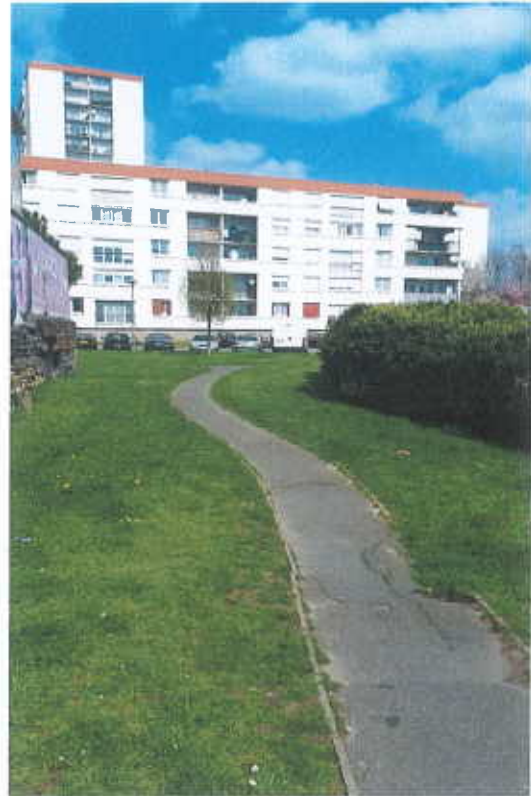
l'accès à la partie centrale depuis l'avenue H Barbusse