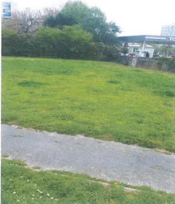
Autre extrémité de la portion à déclasser, vue de la partie centrale à l'arrière de la station-service