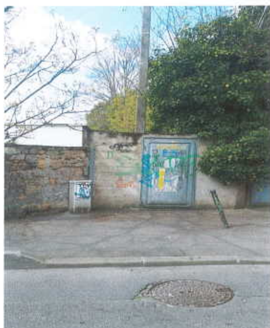
L'accès à la ruelle par la rue Defresne fermé par la porte du transformateur