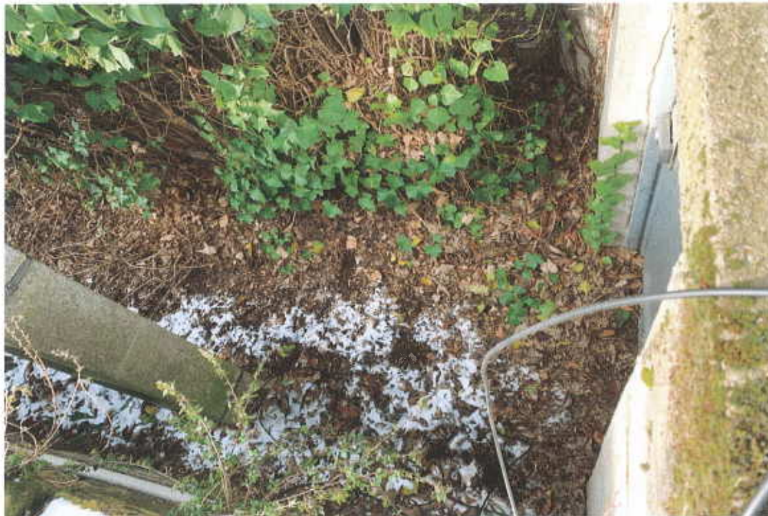
Les débris dans la portion de ruelle soumise à déclassement