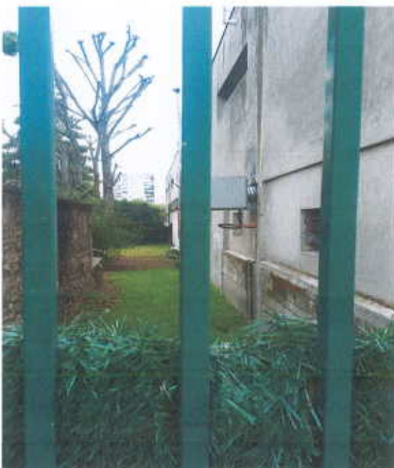
L'accès à la ruelle par la rue Vilmorin fermé par une grille

Le projet prévoit la création de nouvelles voies de circulation routière et piétonne permettant une meilleure desserte du quartier.