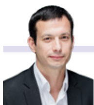
Pierre Bell-Lloch Maire de Vitry-sur-Seine