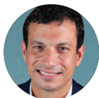
Pierre Bell-Lloch Maire de Vitry-sur-Seine

A handwritten signature in white ink that reads "Bell-Lloch".