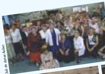
Club de danse Auber.