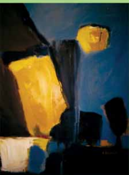
Cosette Gourjon • " Pleine lune " • huile