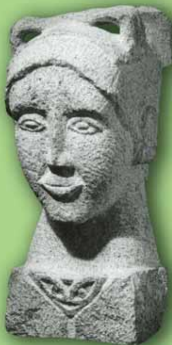
Philippe Mauguen • " la Coiffe " • granite

Maison de la vie associative 36, rue Audigeois • Vitry Entrée libre • ouvert du lundi au samedi • de 14h à 18h