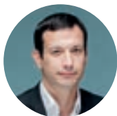
Pierre Bell-Lloch Maire de Vitry-sur-Seine

Je vous souhaite un bel été, chaleureux et frais, ressourçant pour tous et toutes.